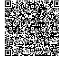
QR-code voor het filmpje over de notaris