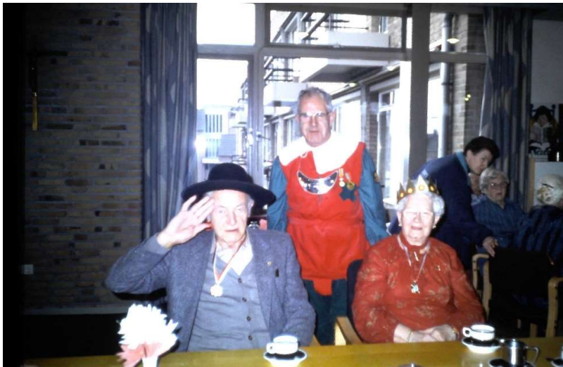
In 2023 zijn honderden dia's van bejaardenhuis De Eikelaar gedigitaliseerd.