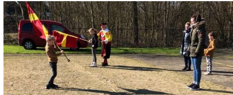
Groep 6 van de Wichelroede mocht vendelzwaaien bij het Gilde

Groep 6 van basisschool De Wichelroede heeft een fietstocht gemaakt door het buitengebied van Udenhout en Biezenmortel, met een rustmomentje bij restaurant De Rustende Jager en een lekkere verrassing op het eind van de tocht bij de IJshoeve Uijenborch. Helaas kwam het bezoek aan de kinderboerderij van Landpark Assisië te vervallen, wegens verbouwwerkzaamheden.