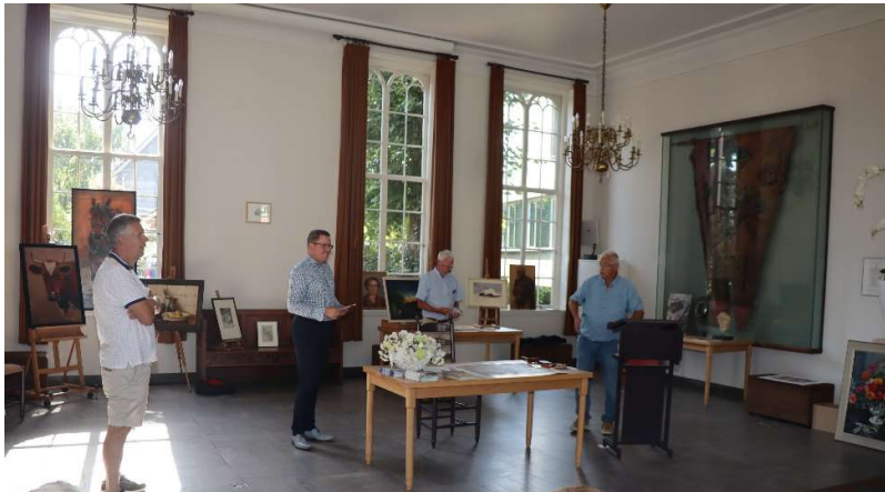
De kunstveiling in het raadhuis tijdens Open Monumentendag

verkoop van tweedehands boeken en men kon informatie krijgen over verschillende digitale bronnen, zoals de notariële archieven, het kadasterarchief en genealogie-online.nl. Ook was het filmpje